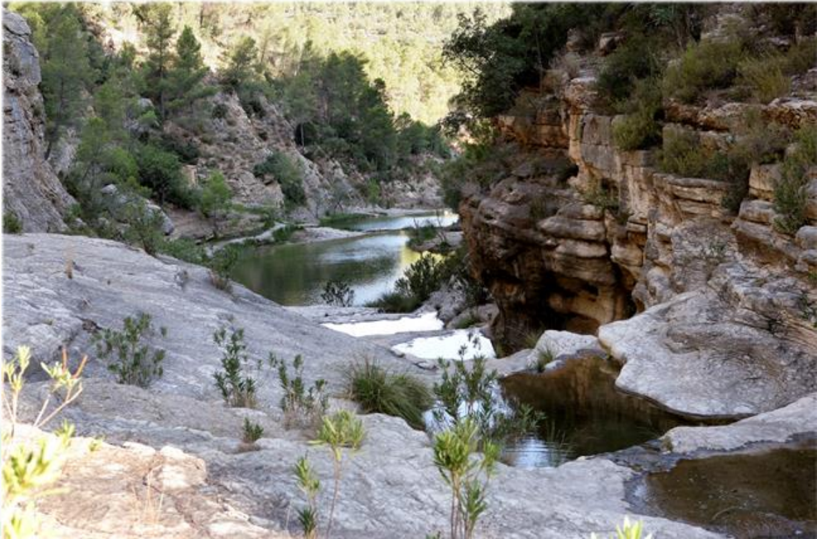
Ilustración: Los Charcos de Quesa (Valencia)

“AMUFOR se constituye en 2006 con el fin de representar los legítimos intereses comunes de casi 1/3 de la propiedad forestal de la Comunitat Valenciana, que es de titularidad municipal. Además, da soporte a los otros 2/3 restantes que son de titularidad privada, pues corresponden a vecinos que viven en nuestras localidades”