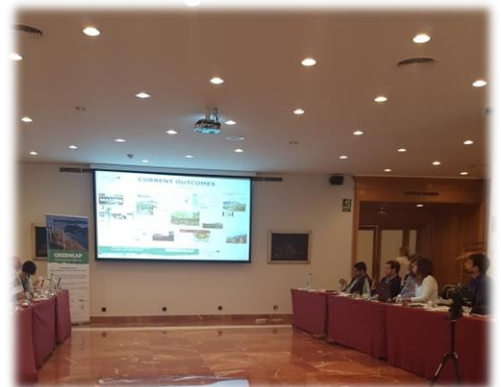
Figura 4. Presentación del proyecto ForBioEnergy en el evento temático organizado por el proyecto Greencap