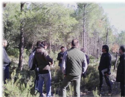
Figura 5. Taller temático en Navalón (Enguera)

La metodología de evaluación de una intervención forestal a través de indicadores que integran los tres pilares del desarrollo sostenible “ambiental, social y económico” antes, durante y después de la realización de la actividad está siendo estudiada en el proyecto ForBioEnergy. AMUFOR y la Cámara de Comercio de Valencia realizaron el pasado miércoles 15.11.2017 un taller temático en Enguera con expertos a fin de identificar los principales indicadores socioeconómicos y ambientales tras el aprovechamiento de la biomasa forestal e intercambiar, al mismo tiempo, estrategias y soluciones operativas a fin de valorizar los beneficios derivados de una Gestión Forestal Sostenible (GFS) y subsidiaria como herramienta para el desarrollo rural en áreas protegidas del Mediterráneo.