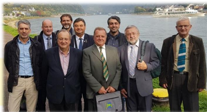
Figura 1. Equipo FECOF

Acceso noticia: http://www.fecof.eu/fecof/en/News/FECOF%20Congress%202017%20in%20Rhineland-Palatinate/